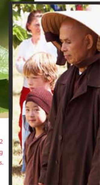
Thich Nhat Hanh richtte in 1982 Plum Village op. Hij houdt daar nog steeds wandelmeditaties.