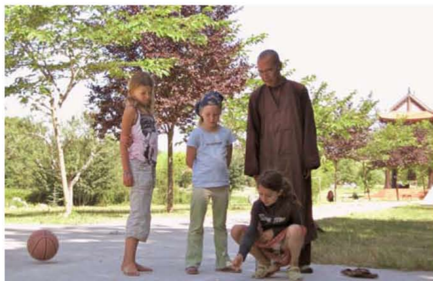
Zomerretraite in Plum Village betekent voor de kinderen weken vol vrijheid, blijheid.