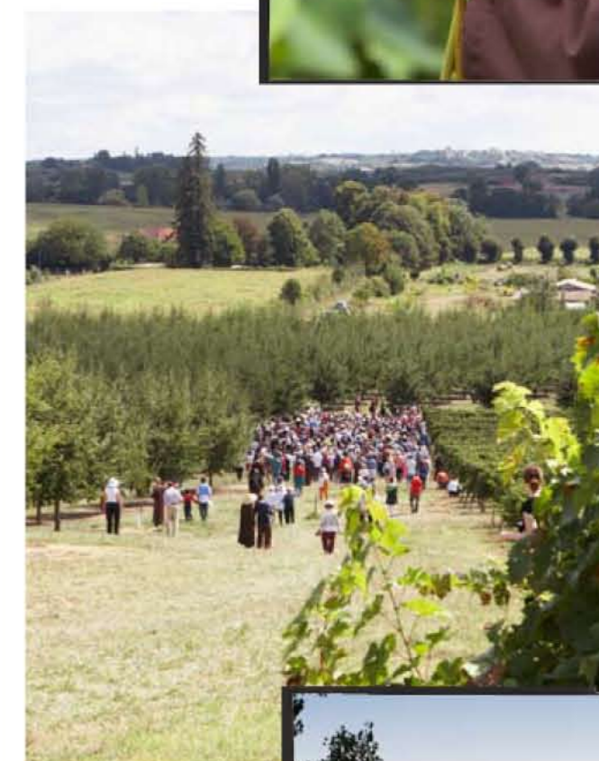
De dagelijkse wandelmeditatie, waarbij je je heel langzaam en bewust voortbeweegt. En dat met heel veel mensen tegelijk.